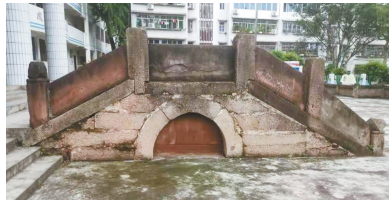
石盘万寿宫旧址(状元桥)。