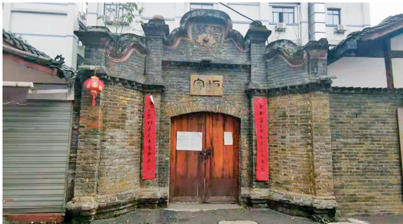
位于成都市青羊区马镇街12号的寄庐。