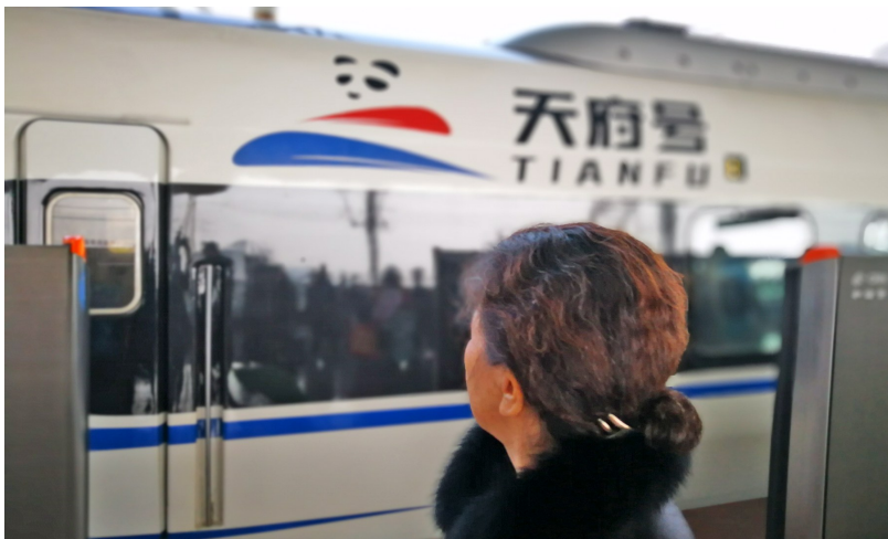
2019年1月,新型公交化高铁动车组在成都(彭)和成雅铁路率先投运,“天府号”逐渐成为沿线群众最便捷舒适的出行方式。(本报资料图片)

2018年12月,为了满足市民公交化出行需求,CRH6A-A型动车组在成灌铁路正式上线,其少坐席、多站立区的车内格局可容纳更多人员乘