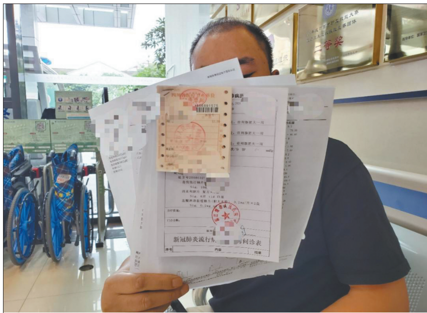
杨先生展示就医检查单。