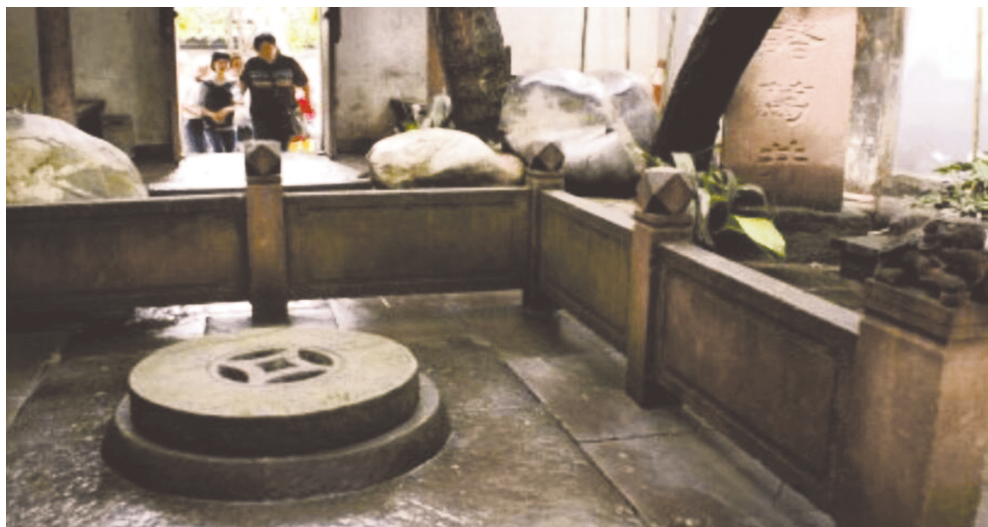
成都锦里古街中的诸葛井。

成都地下水丰富，旧时城内水井众多，其中有一口诸葛井，位于今春熙路附近，相传为诸葛亮治蜀时所凿。据史料记载，诸葛井造型奇特，为双眼井；井台离地面高约一尺，呈八角形，由一整块大青石板砌成，上面雕刻有八卦等图案，四周立有石栏；井身上窄下宽，约两丈深，井壁均以来自青城山的黑色青石砌成。诸葛井历史悠久，不仅为历代典籍所载，更被赋予许多神秘色彩，为老成都人津津乐道。