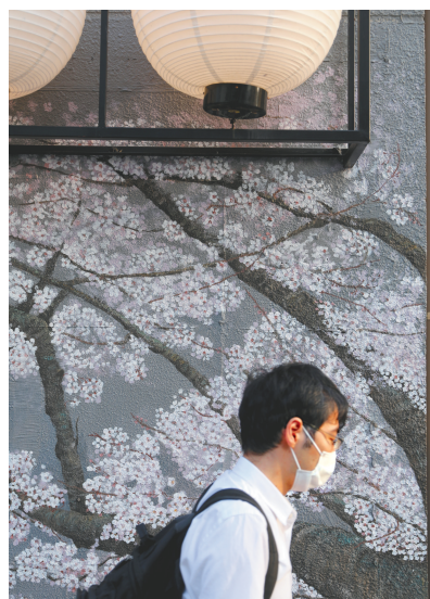
7月31日,在日本东京,一名男子戴口罩出行。

日本全国单日新增确诊病例7月29日起连续三天超过1000例,7月31日全国新增确诊1557例,再创新高。