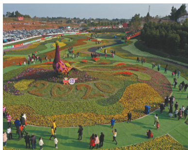
依托园区,乐至县举行首届迎春赏花节。