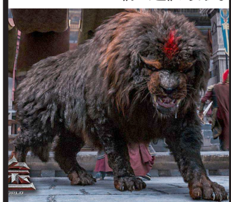
片中让人印象深刻的“神獒”。