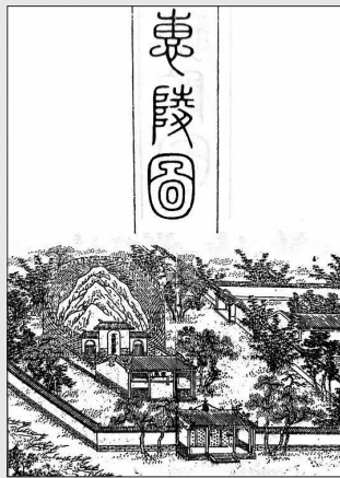
《惠陵图》 (来源:《昭烈忠武陵庙志》校注)