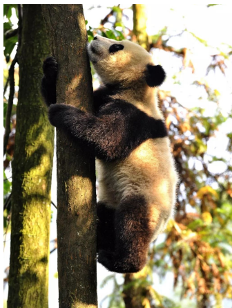
在学爬树的大熊猫幼崽。