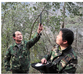
工作人员在野外监测受训大熊猫。

音犹如野兽的喘息，但两个人知道这应该是林间的风声。不一会儿，风声渐停，四野恢复平静。