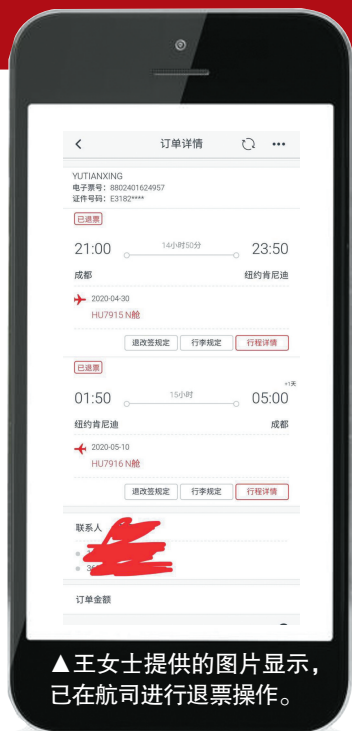
▲王女士提供的图片显示，已在航司进行退票操作。