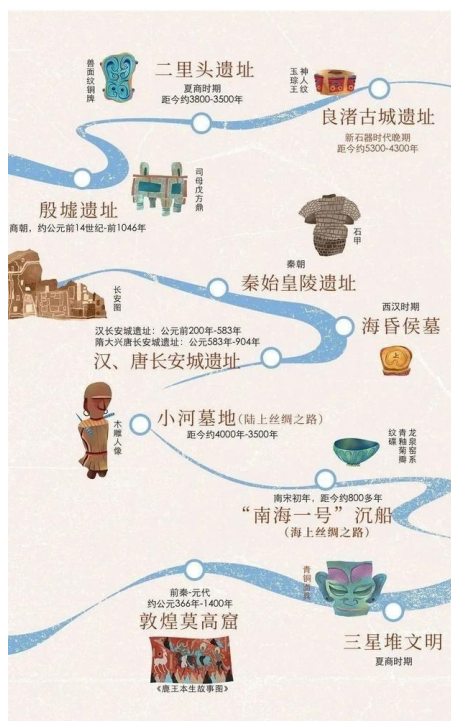
中国十大重大考古发现，缘起都市肌

什么是“文明”？中华5000年文明如何证明？最早的中国在哪里？殷墟的甲骨文写了什么？三星堆文明与中国以外的上古文明有何相似性？海昏侯墓为什么那么多金子？长安城最繁华的商业街长什么样？水下考古怎么考？莫高窟为什么是世界艺术宝库？“上下五千年”早已刻入每一位中国人的基因，而考古学让我们看到另一个与古籍文献所载的中国相似又不同的华夏，也许难说二者谁更“真实”，但可以肯定的是，我们所能见到的中华文明景观，得益于考古学的襄助，已经殊为精彩，蔚为大观。