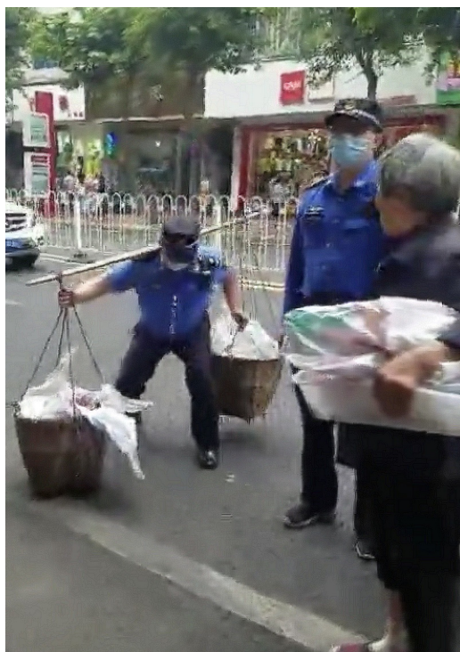
城管执法队员帮老人挑水果。(视频截图)