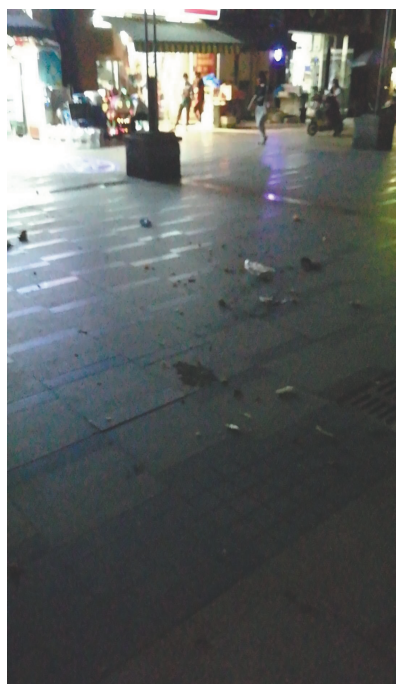
夜间高空抛物。

业主们称，5栋楼下小广场是小区主门通道，也是很多小朋友喜欢玩耍的公共区域，“楼下有超市，也有很多人经过那里，要是砸到人，后果不堪设想。”