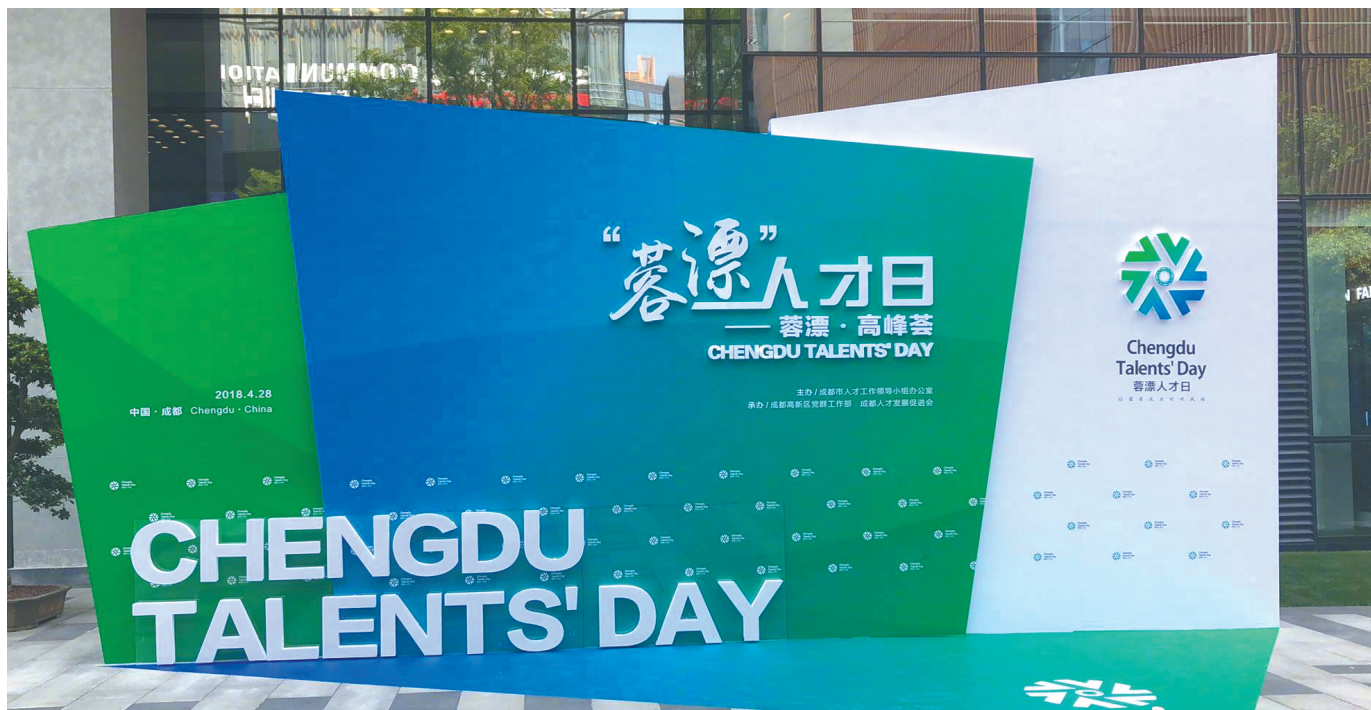
“蓉漂·高峰荟”在成都市高新区菁蓉国际广场举行。