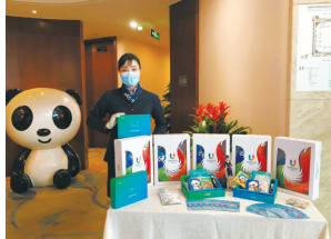
东航在贵宾室发放蓉漂礼物。