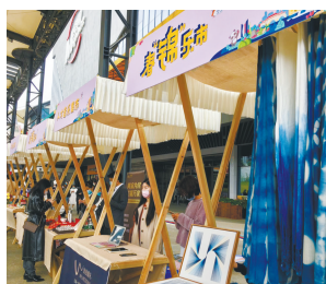
成都市锦江区人才音乐市集。

4月25日,成都迎来第三个“蓉漂人才日”。今年的系列活动紧扣成渝地区双城经济圈建设,更加聚焦开放合作、更加注重人才感知,从更高层次、更宽领域推动人才、产业、区域发展融合。活动还特别邀请到重庆市人才工作代表团,进一步推动两地人才协同发展,加深合作。