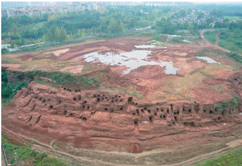
金堂中兴村崖墓群全景。

4月27日，成都文物考古研究院对外发布，从去年4月开始，经过近一年发掘，在成都金堂清理发掘了219座崖墓。该崖墓群年代集中于东汉晚期至六朝时期，分别有大型墓葬、中型墓葬、小型墓葬。墓群出土铜、银、铁、玻璃、陶、瓷质器物600余件。