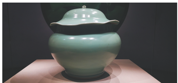
南宋青釉荷叶形带盖瓷罐。