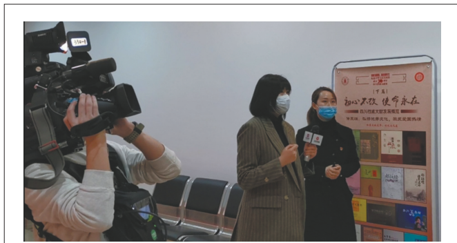
全网68.4万人观看了本次直播。

在某些文艺作品的演绎中,旧时家庭中如妻子犯了“七出之条”,则可能面临一纸休书,“休妻”一词