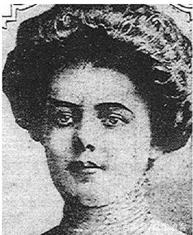
“伤寒玛丽”，美国发现的第一位无症状伤寒杆菌带菌者。