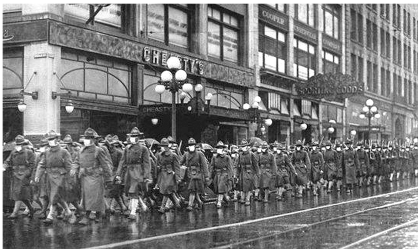
一战时戴着口罩的士兵。