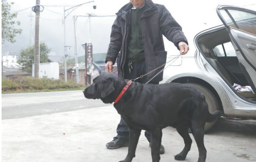
▼ 获救后的辛巴暂时被村民照顾着。

没去上班,便拨打了110报警电话。警方调查后发现,男子在彭州九峰村出现过,但并不确定是否登山。当地村委会排查后,发现男子没有在山下住宿点入住,便推断他已经上山。