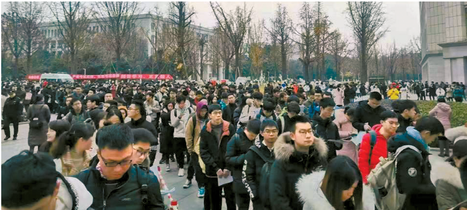
2020年全国硕士研究生招生考试电子科大考点。

为了满足考生需求，今年四川全省考点增加到53个，启用近6000个标准化考场，安排考务人员和监考员近2万名。