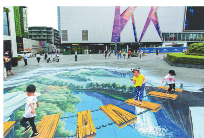
“2019成都国际地景涂鸦艺术节的3D涂鸦”。