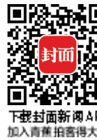
下载封面新闻APP 加入直播拍摄大奖