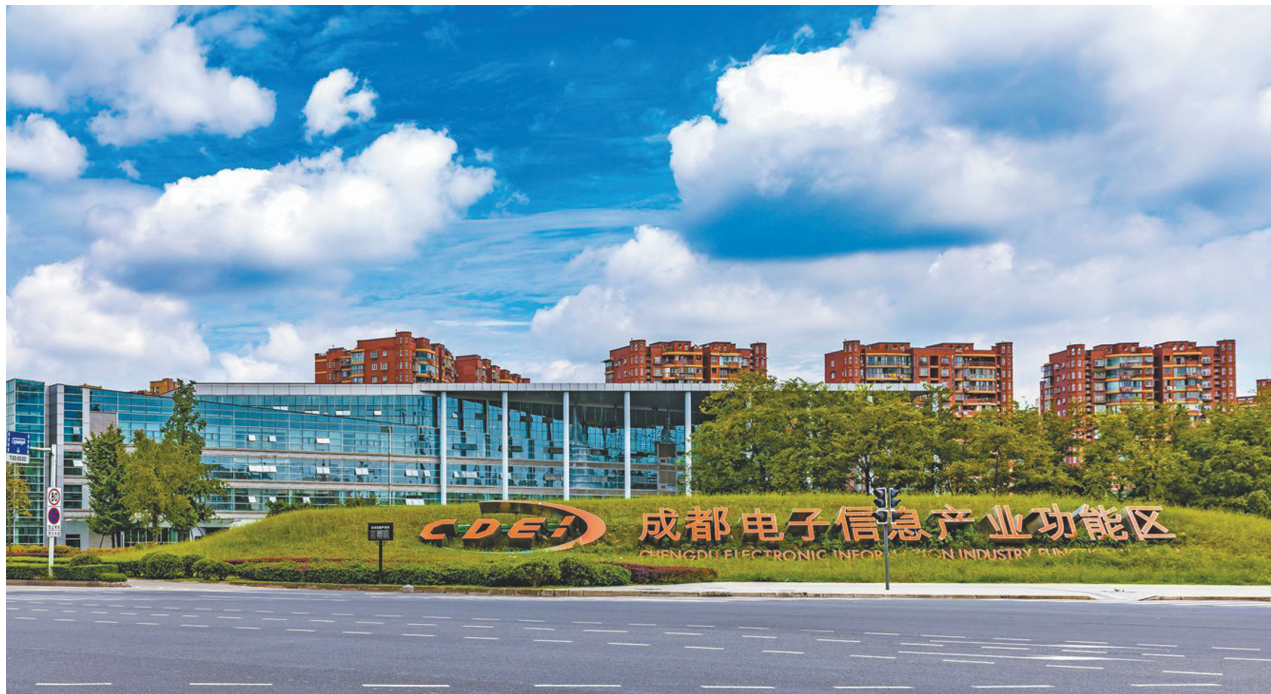
成都电子信息产业功能区。

作为四川经济界“奥斯卡”，该活动在聚焦2019年度四川经济界重磅人物，盘点2019年度四川经济影响力事件的同时，新设立“2019四川十大产业园区”榜单。目前，该榜单竞争激烈，总票数已达到118099票，其中成都产业功能区“组团”参与角逐。