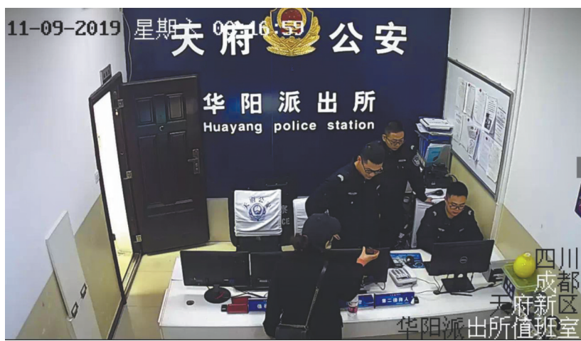
张女士到华阳派出所报案。

通过“天网”监控，她看到儿子径直走进了一家医院，出来后上了一辆三轮车，不知去向。