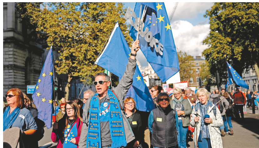
10月19日，在英国伦敦，反对“脱欧”的示威者参加游行。

英国议会下院伦敦当地时间19日投票通过一项关键修正案，实质上迫使首相约翰逊致信欧盟，寻求再度推迟“脱欧”。但约翰逊随后表示，即使有法律要求，自己也不会再与欧盟谈判推迟“脱欧”。英国目前定于本月31日正式退出欧盟。