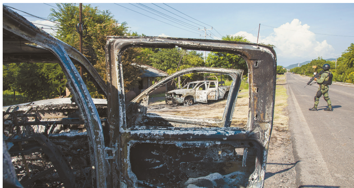
在库利亚坎枪战的同一周，13名警察14日在米却肯州遭毒贩伏击身亡。图为被毁坏的警车。