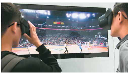
10月19日,参观者在乌镇举行的互联网之光博览会上体验VR体育赛事直播。

每年,世界互联网大会领先科技成果都会成为关注焦点。据悉,今年的成果将从申报的微软、SAP、领英、甲骨文、特斯拉等多家外企以及中国移