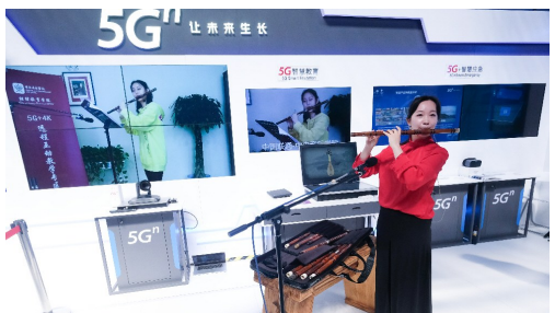
10月19日,互联网之光博览会,工作人员在展示基于5G技术的远程互动音乐教学。

动、中国电信、中国电科、华为、阿里、腾讯、百度等央企和知名互联网企业,清华大学、浙江大学、西安交通大学等知名高校中选出。