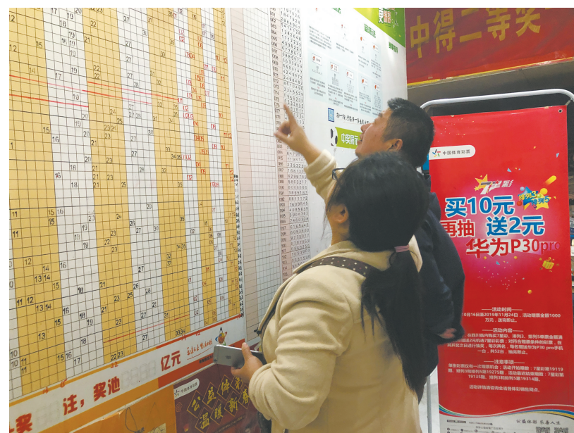
成都市区一家体彩店内，活动吸引购彩者前来体验。

四川的购彩者们，一个重磅利好消息华丽丽来了，快快接住：四川省体育彩票管理中心对7星彩、排列3和排列5玩法开展全省大促销活动了。从10月16日起，凡活动期间在四川省内体彩网点购买7星彩、排列3、排列5游戏，单张彩票金额满10元即赠送2元机选7星彩票。 据了解，整个计划赠票1000万元。更令人心动的是，购彩者还有机会赢得P30pro手机。目前，全国各地已经将促销活动的海报张贴了出来，受到了购彩者们的追捧。