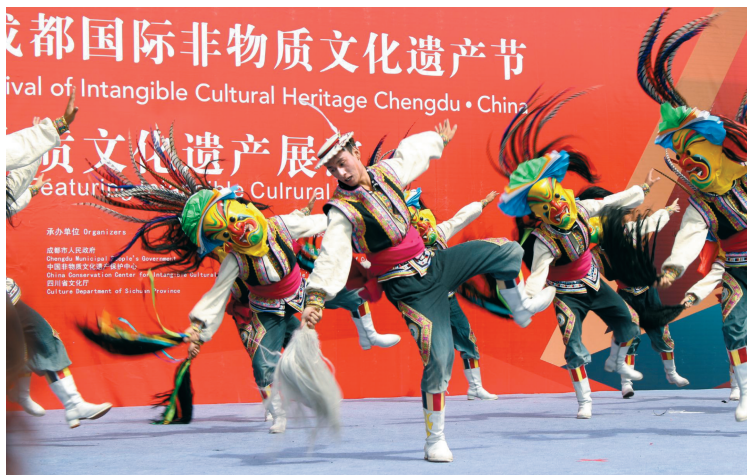
往届非遗节给观众留下了深刻印象。(资料图片)