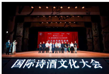
“诗意浓香”全球征文赛事颁奖现场（金奖）

盛典现场，各组别金银铜奖及特别奖获得者登台领奖。无论是成名已久的诗坛名宿，还是崭露头角的校园新人，都通过国际