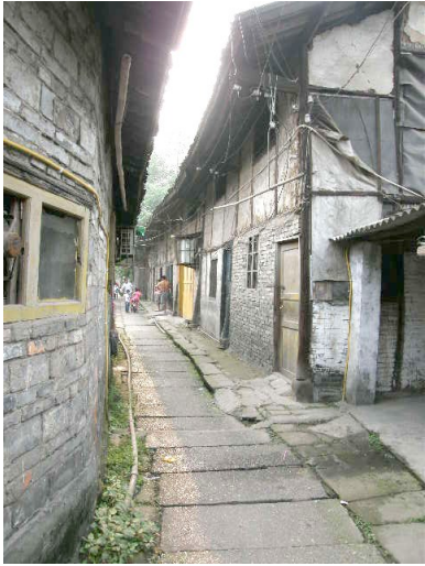
蓝田力行路麻元巷。