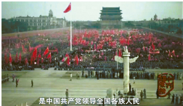
中华人民共和国中央人民政府成立典礼原始影像。(视频截图)