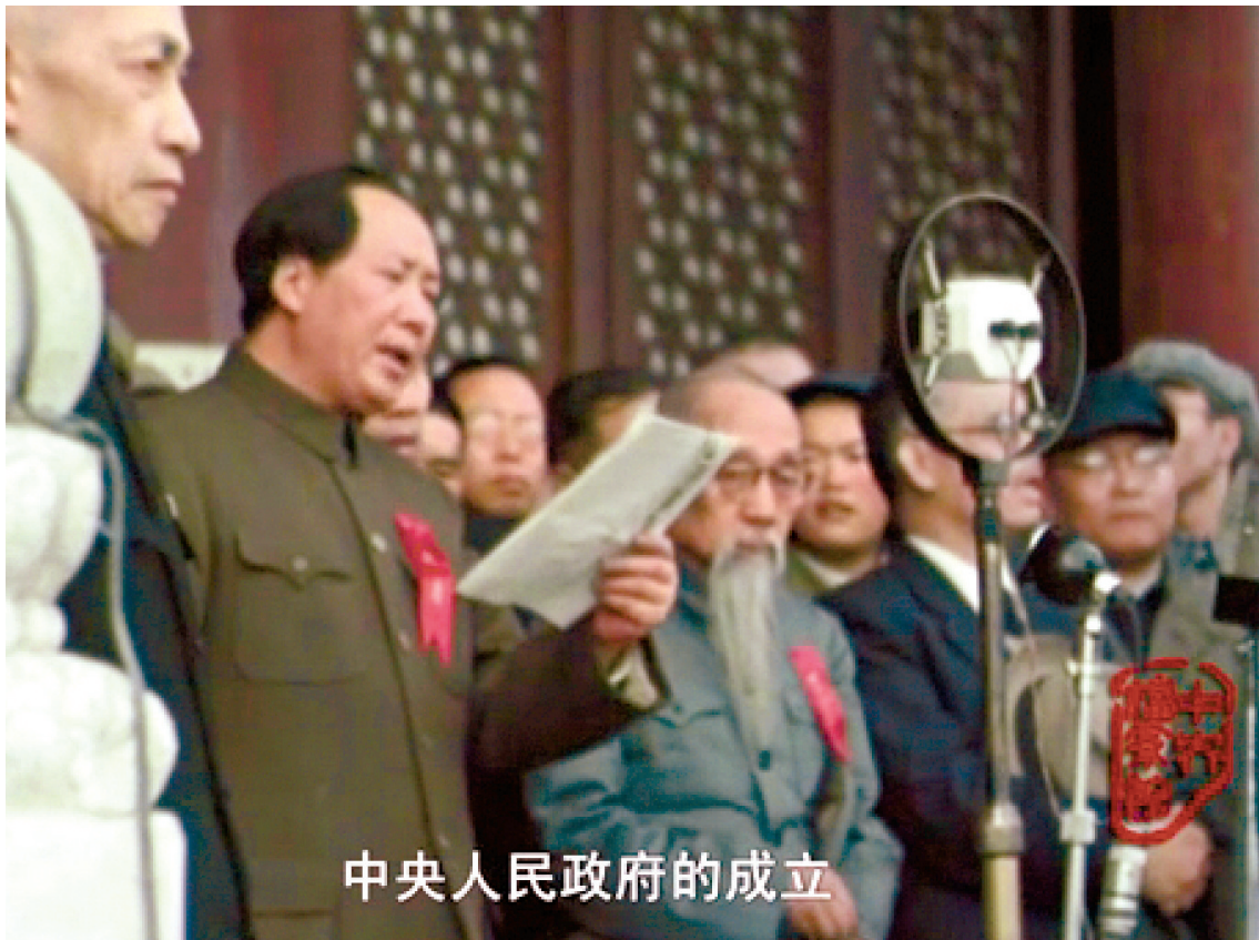
中央人民政府的成立

回顾历史是为了服务现实、展望未来。中央档案馆推出“从‘五一口号’到开国大典”大型档案文献专辑,力图以原始档案文献重温新中国成立那段光辉历史,更加深刻展现中国共产党的初心使命,鼓舞广大人民群众爱党爱国的巨大热情,为实现“两个一百年”奋斗目标和中华民族伟大复兴的中国梦而不懈奋斗!