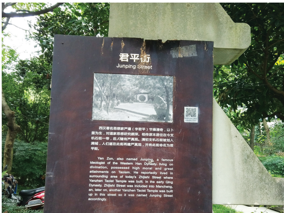
君平街上关于严君平的介绍。