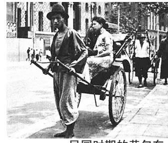
民国时期的黄包车。

人力车，旧称“东洋车”，以日本率先使用得名。而成都民间则每每称它为“黄包车”。人力车因其小巧灵活，适合大街小巷穿行，方便舒适且价不贵，故民国时期是成都广为采用的交通工具。抗战时期，因成都外来人员很多，人力车发展尤为迅猛，呈现出一个高峰期。据《成都通史·民国卷》记载，1945年，成都人力车公司、车行多达700家，有车11260辆，车工3万余人。