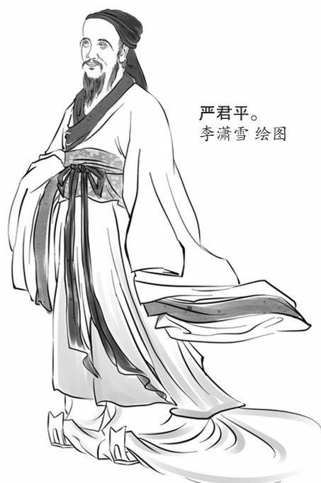
严君平。 李潇雷 绘图