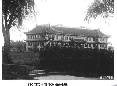
华西坝教学楼。摄于上世纪三十年代初

100多年前的一座座中西合璧的大建筑的设计图:讲究平衡,对称,使用灰色砖,小青瓦,大屋顶……线条是如此规范,数据是如此准确,整体是如此恢弘,细节是如此精彩。