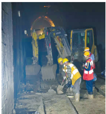
前两次铁路中断之后，抢险人员在隧道内抢险。

目前，失联人员救援工作正在进行中，省应急管理厅已调集消防救援队伍、甘洛矿山救护队等救援力量在灾害现场开展人员搜救。同时，凉山州消防支队、荣经矿山救护队也赶往现场增援。