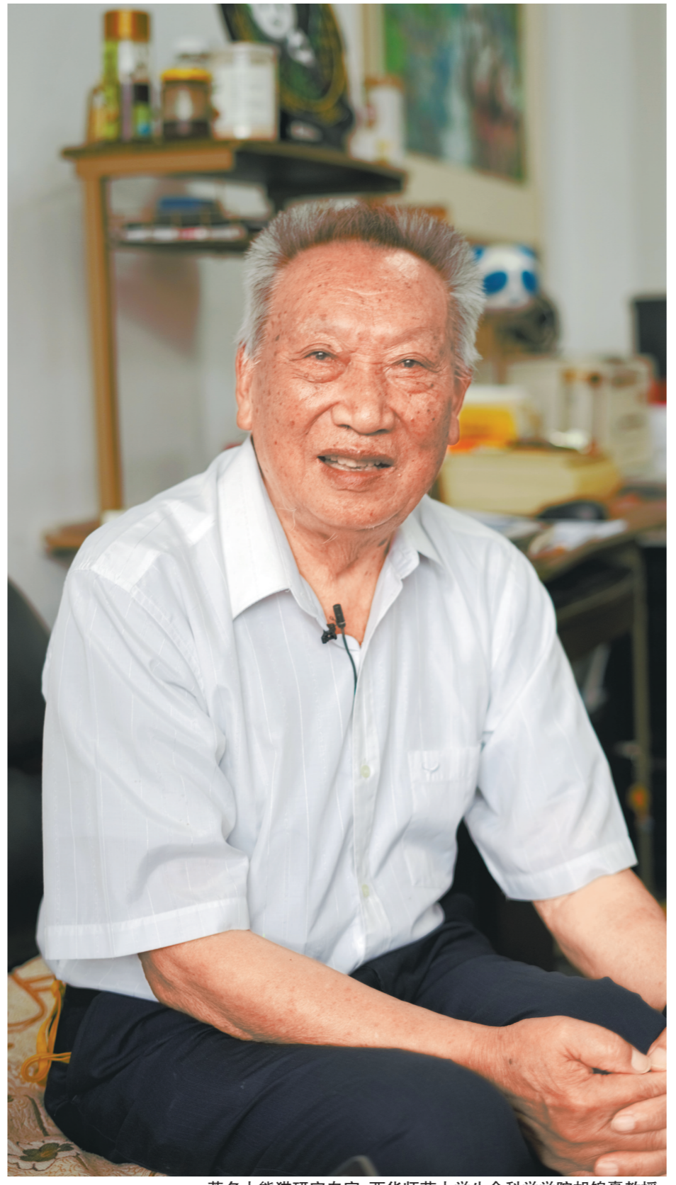
著名大熊猫专家、西华师范大学生命科学院胡锦涛教授。