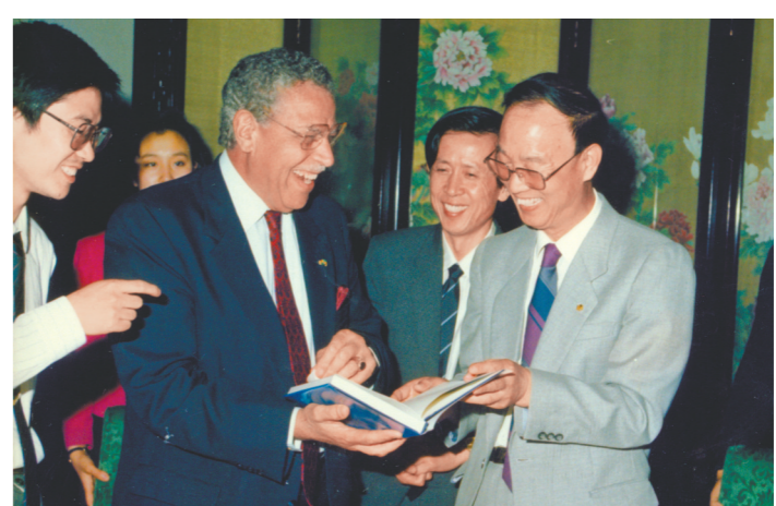
1990年9月,夏堃堡(右二)陪同曲格平(右一)进行外事活动。