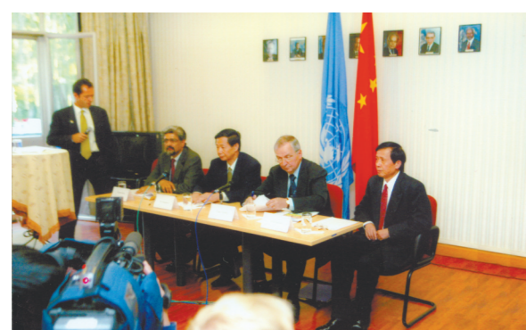
2003年9月19日,联合国环境署驻华代表处成立。

“有幸遇‘引路人’ “曲格平是我国环保事业的开创者之一,也是我环境外交生涯的引路人”