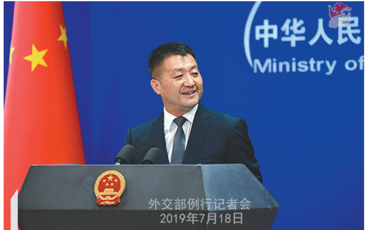
2019年7月18日,外交部发言人陆慷主持例行记者会。

姚遥说,在陆慷担任外交部发言人后,自己曾带着学生们去跟这位大师兄座谈,陆慷深情鼓励学弟学妹们“读万卷书,行万里路”,将来不论面对何种挑战,胸中要有长期积累的“底气”;在成长过程中要踏实勤奋,耐得住寂寞,有“坐十年冷板凳”的韧性与耐力;在规划未来人生时,要将自己与国家、民族、社会融为一体,“心胸有多大,天地就有多大”。