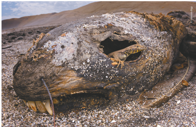
这些即将亮相成博的大师作品确实非常令人震撼。

7月8日，记者从主办方获悉，展览将从7月16日展出至9月1日，免费面向公众开放。这100幅动人心魄的摄影作品，既能让你在博物馆里找到逛动物园的乐趣，也能让你对野生动物的处境和地球的命运产生一些反思。