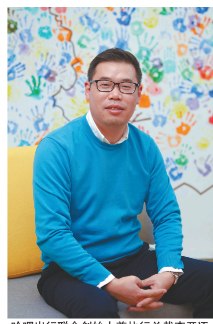
哈啰出行联合创始人兼执行总裁李开逐。