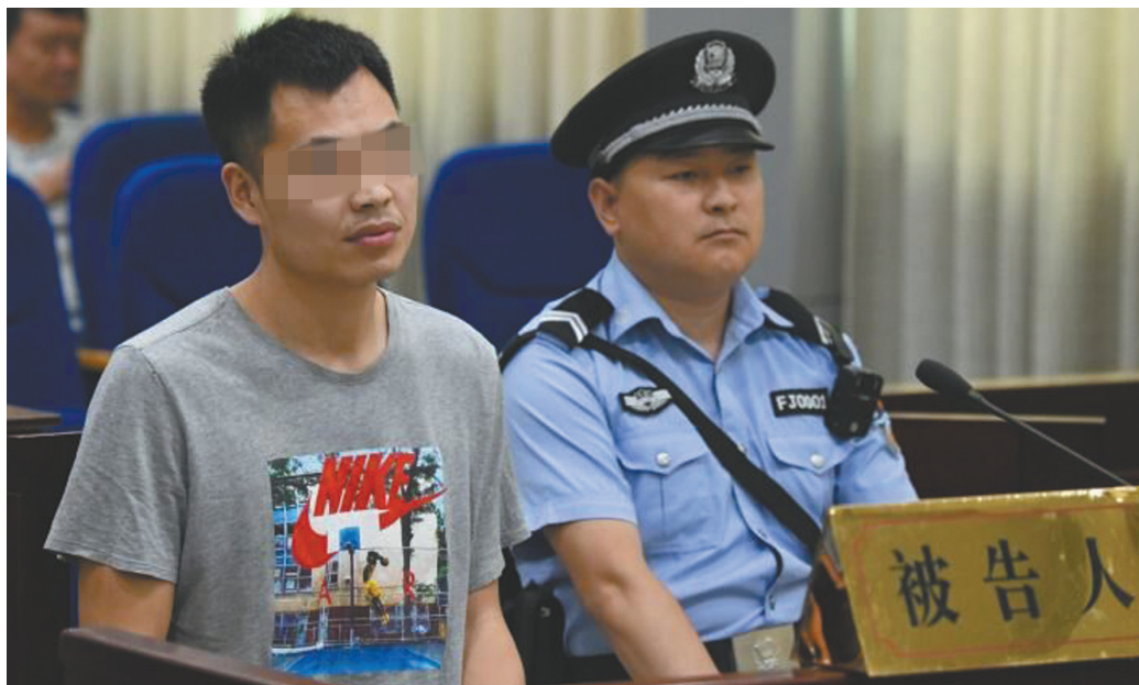
6月12日,河南栾川县法院开庭审理“掌掴老师案”。