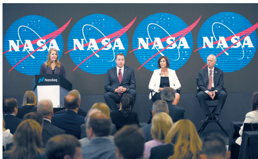
6月7日,美国航天局在纽约举行新闻发布会。

此前,俄罗斯“联盟号”飞船已将多名私人游客送往国际空间站。2001年,美国商人丹尼斯·蒂托支付了2000万美元,在国际空间站停留了8天,成为人类历史上首位自掏腰包的私人游客。