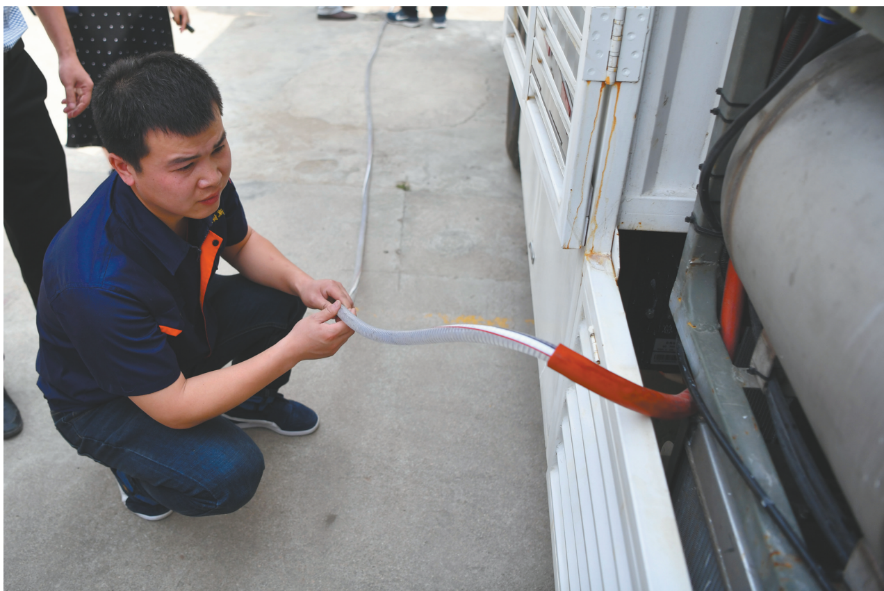
南阳洛特斯新能源汽车有限公司工作人员在为“水氢发动机车”注入水(5月25日摄)。

那么,“车载水解制氢”是否可以实现?南阳政府是否对该项目投入巨额资金?该企业是否为一家严重失信企业?针对公众关心的几个核心问题,记者实地采访了相关政府部门、企业以及行业专家。