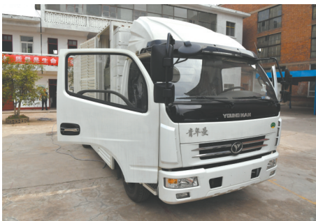
在南阳洛特斯新能源汽车有限公司厂区展示的“水氢发动机车”。