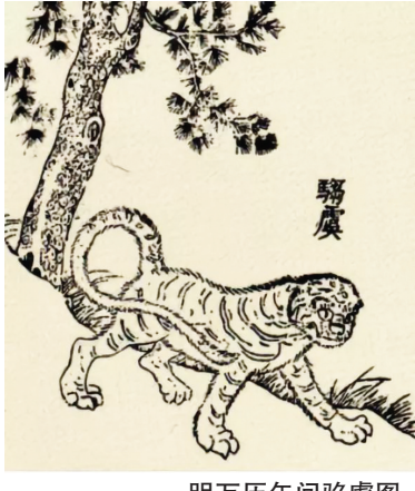
明万历年间驺虞图。

以上引典说明，古往今来“貔”“貔貅”是一个常用词汇，绵延数千年特指一种勇猛异常的猛兽，无论天上人间，它都是以威猛、骁勇善战的形象出现，并不是大熊猫的可爱形象。