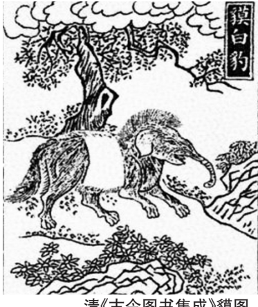
清《古今图书集成》貔图。