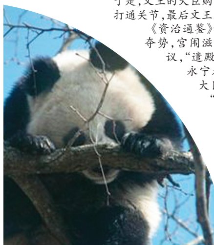
2010年在摩天岭拍摄到的大熊猫。