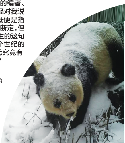
2018年四川小寨子沟国家级自然保护区红外相机拍摄的野生大熊猫。

1869年，法国传教士、博物学家阿尔芒·戴维在四川省穆坪(今宝兴县)盐井乡邓池沟科学发现世界第一只大熊猫的新物种，在欲带活体回国未果的情况下，将其制作成标本带回巴黎自然博物馆，从而让大熊猫这个珍稀物种为世人所识。随后，对它的命名在科学界长期争论不休，但最终国际学术界还是普遍采纳了法国学者米勒·爱德华兹的研究成果，把这个新发现的物种定名为“大熊猫”。1939年，重庆平民动物园举办了一次动物标本展览，其中“大熊猫”标本最吸引观众。它的标牌采用的是国际流行的书写格式。由于中文读法是从右往左读，所以参观者一律把“猫熊”读成“熊猫”，久而久之，人们就约定俗成地把“大熊猫”叫成了“大熊猫”。