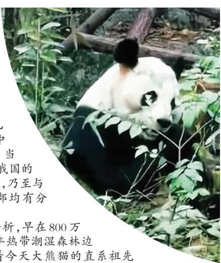
2019年1月，熊猫基地正在吃竹子。