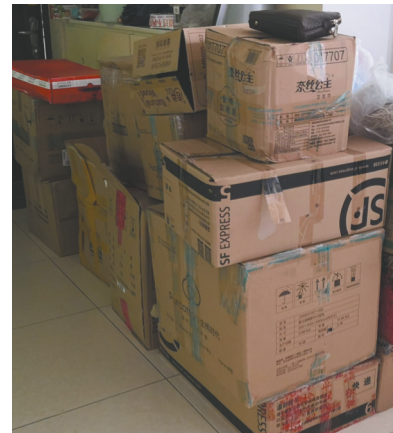
未拆包装的快递盒。