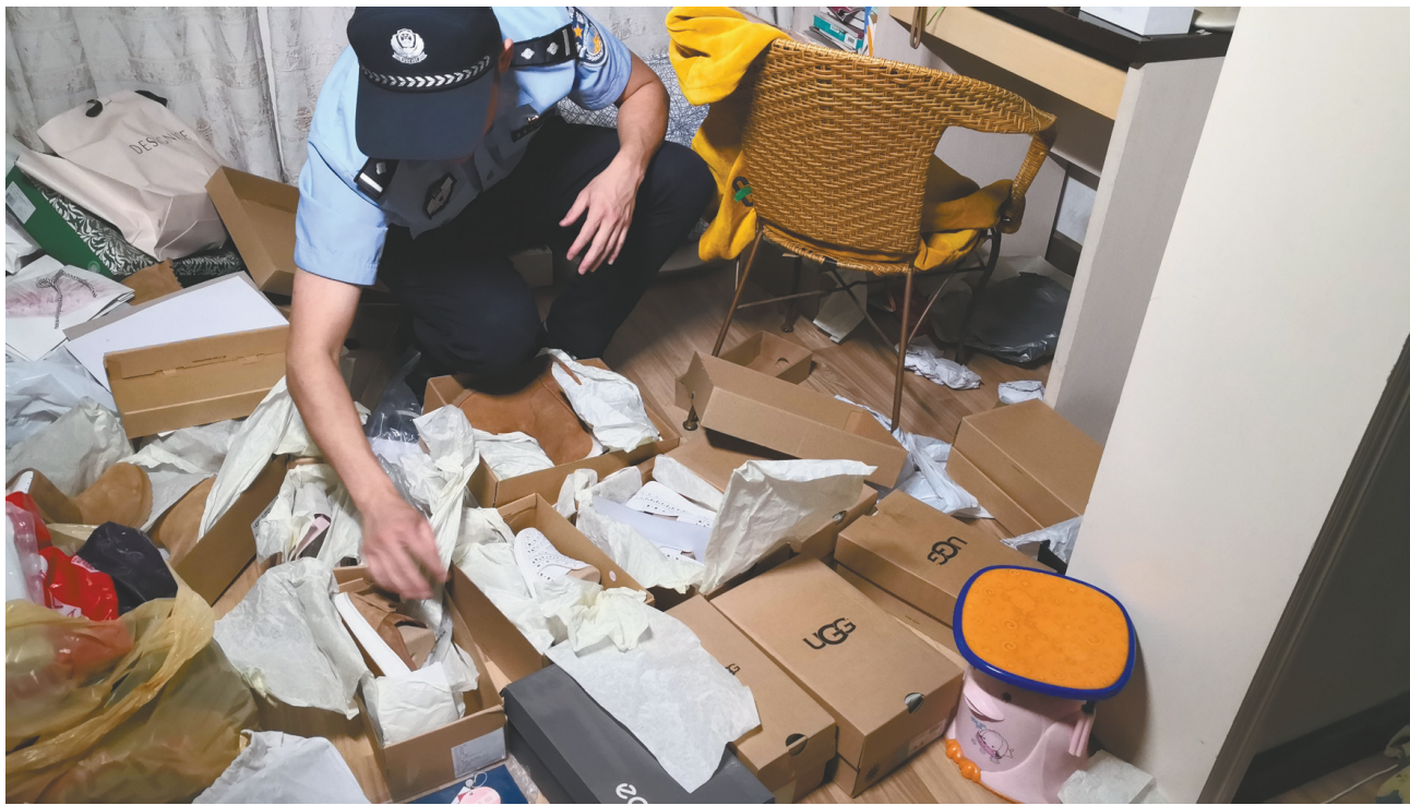
警方调查发现大量的UGG鞋子。