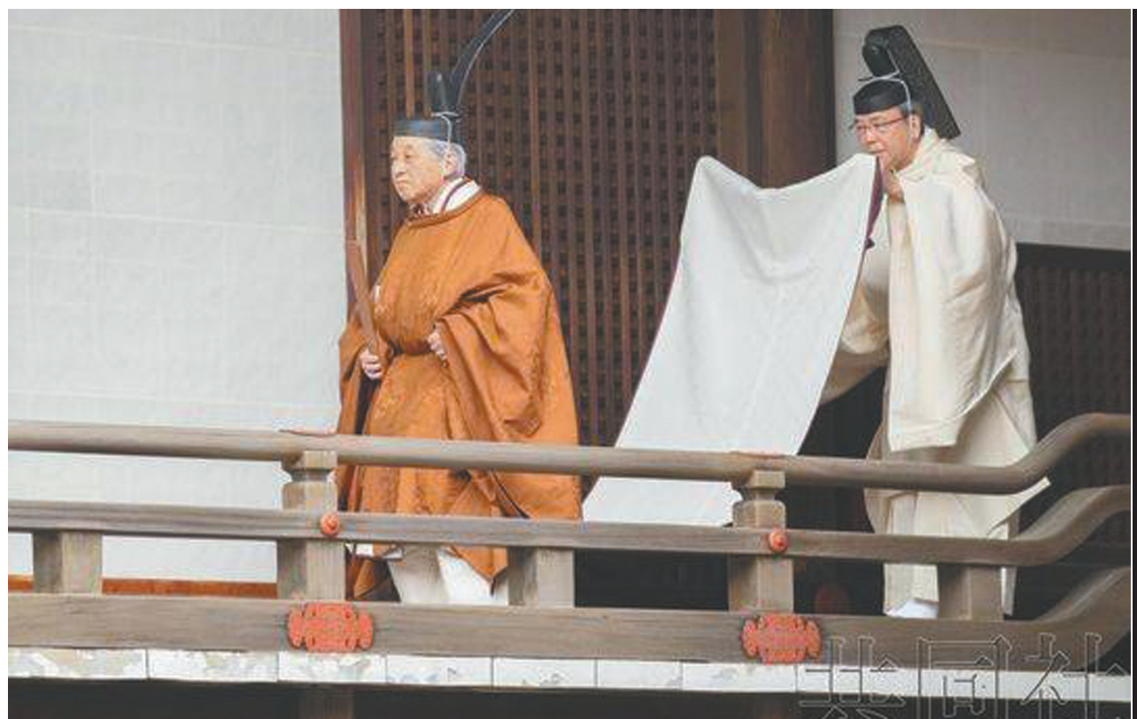
明仁最后一次以天皇身份祭拜先皇。