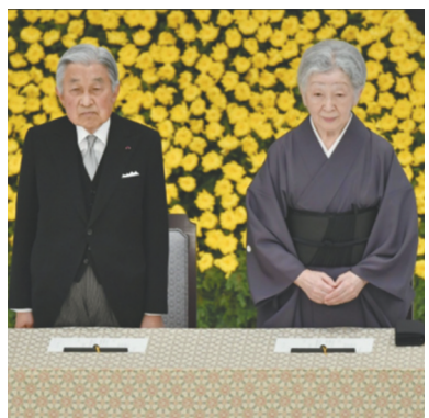
日本明仁天皇和皇后。

明仁生于1933年12月23日，1989年在他父亲裕仁天皇去世之后继位，是日本第125代天皇，年号“平成”。2016年8月，他发表视频讲话