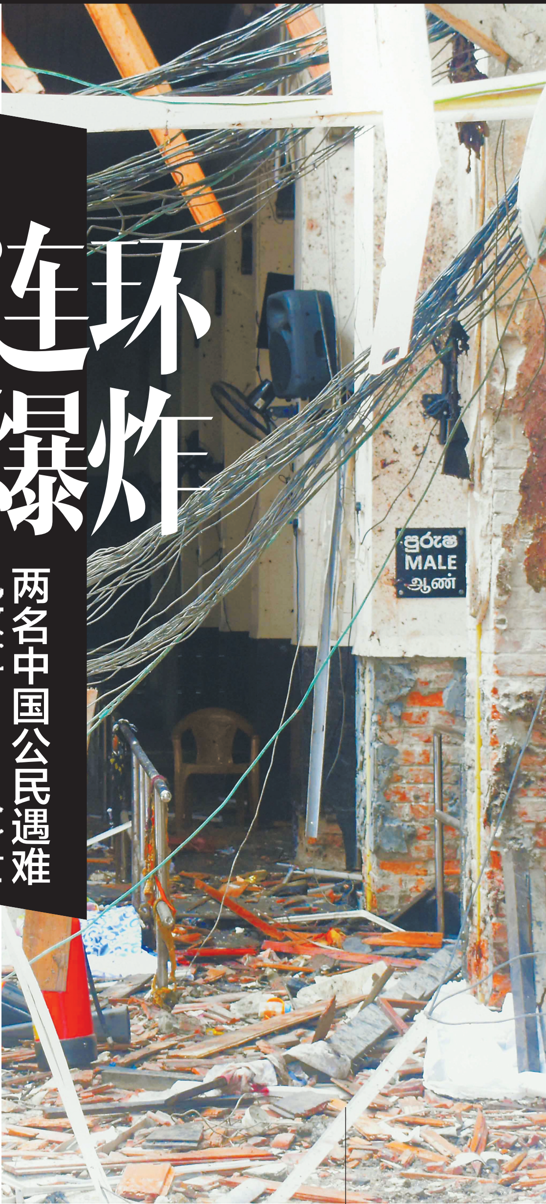
4月21日，科伦坡，发生爆炸后的圣安东尼教堂内部。