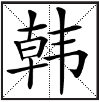
《说文解字》释义：韩，井垣也。从韦，取其币也。于声。

明清时期，江浙一带的韩姓人，大规模继续南迁。清康熙年间，已有韩姓人迁入中国台湾。此后，有的还向海外发展，移居菲律宾、马来西亚、新加坡等东南亚国家和地区以及欧美一些国家和地区。明朝时的四川韩姓人，在经过长期的沉寂后，逐渐显现出来，出了多个名人以及大家族。