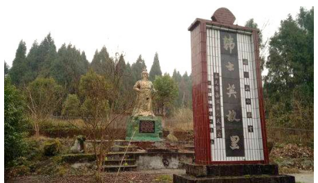
南充世阳镇韩氏祠后山半腰的阁老坟前，新塑了韩士英的戎装像。

南充市嘉陵区世阳镇马兰沟村有一座山叫龙凤山，山梁上有阁老坟，山下马兰沟楼房湾有一处韩氏祠遗迹，2018年9月，新修的韩氏祠竣工。这里，在明朝中期出了一个著名的韩姓人物——明嘉靖年间的南京兵部尚书韩士英。