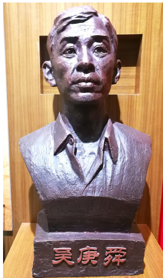
安州博物馆内的吴庚舜塑像。