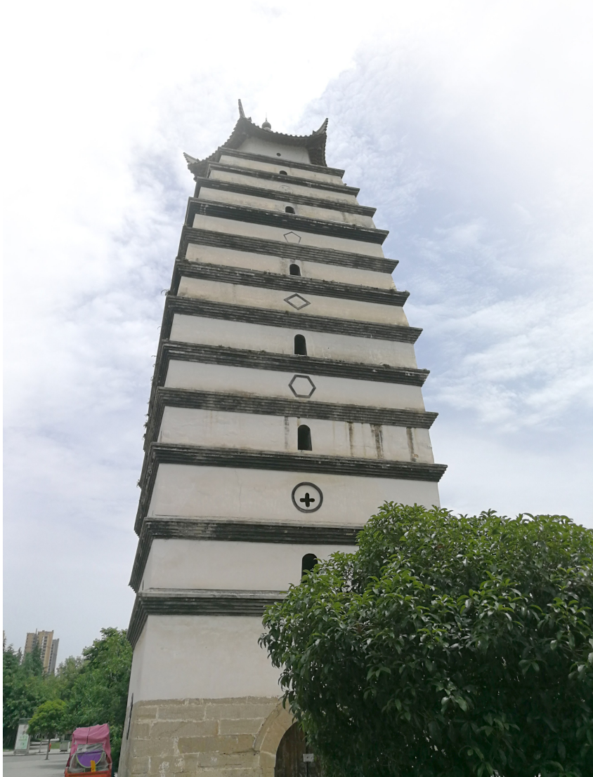
重建后的安州文星阁。

吴庚舜还参与了文学所里的另一个重点工作《唐诗选》的编写工作,钱锺书作为古代组的学术带头人,对此付出了不少心血。前期工作中,他负责撰写的小传和注释,具有《宋诗选注》一样的特色。后期是修改阶段,他对作家作品的增删和注释都提出了中肯的意见。如1975年,他给全体编写组成员写的一封信说:“增选目已一一校对原诗,鄙见五纸附呈,陶诗所谓‘所言多谬误,君当恕醉人’也。杜、韩、三李等大家篇什,加添者皆允惬,无可议,足衡鉴之公明,甚佩。”钱锺书的热情支持之意溢于言表。