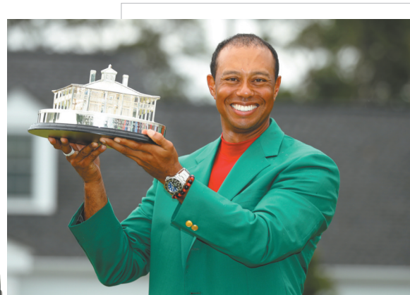
伍兹时隔11年重返巅峰。