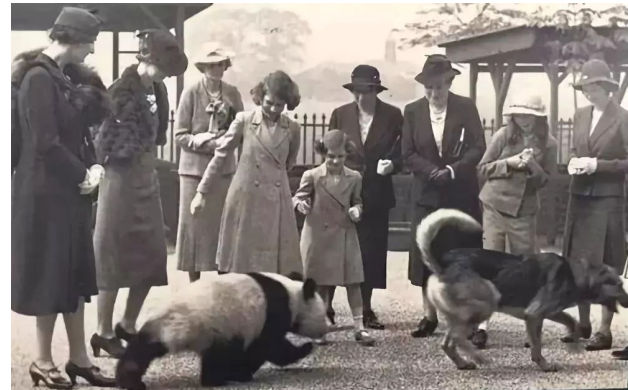
伦敦动物园。伊丽莎白公主(左四)、玛格丽特公主(左五)和大熊猫“明”在一起。(1939年)

全国第四次大熊猫调查结果显示，截至2013年底，全国共发现1864只野生大熊猫，超七成分布在四川。