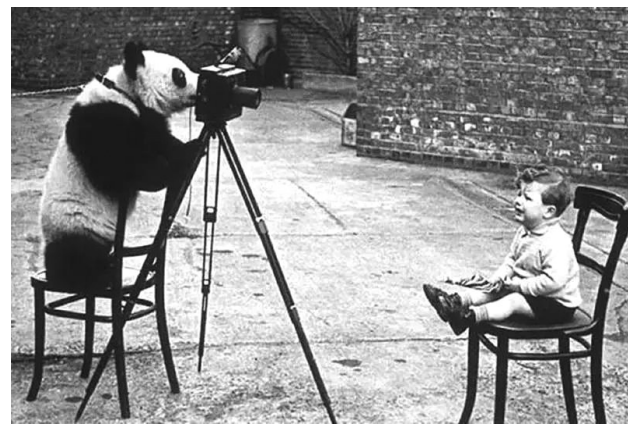
大熊猫“明”当上了摄影师(1938年)。