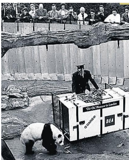
1958年，伦敦迎来熊猫琦琦，她是世界野生动物基金会会徽上的熊猫原型，也是伦敦动物园史上最受欢迎动物之一。