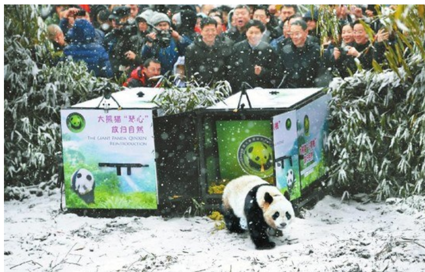
2018年12月27日，大熊猫“小核桃”放归自然，这也是首次在成都野化放归大熊猫。

“戴维的发现，是现代科学意义上的发现，其学名是按动物分类学要求命名的，所遵循的是国际公认的标准。”著名大熊猫文化专家谭楷介绍，戴维在中国12年，发现了189个新物种。其中包括大熊猫、金丝猴、羚牛、麂鹿、珙桐(鸽子花)、大叶杜鹃、报春花等。他还给世界留下了珍贵的《戴维植物志》，曾是西方探险家按图索骥，寻找植物新种的“行动指南”。还有《中国鸟类》，记录了许多现今中国已消失的品种，以及《中国动物》三大卷。