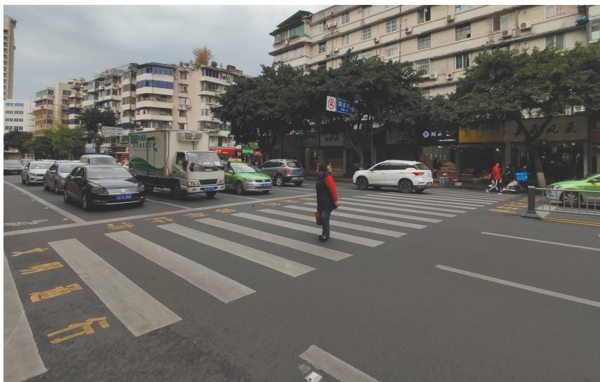
近日，成都市长顺下街与三道街交叉路口，首批“人车安全通行组合标识”亮相。