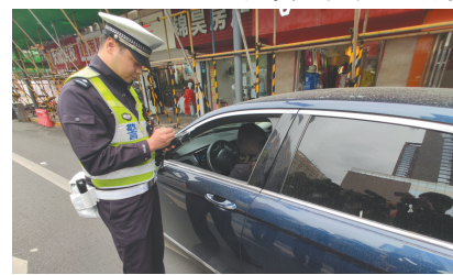
交警对未礼让行人的驾驶员进行处罚。

4月3日上午，在成都市长顺下街与三道街交叉路口。路过的不少行人发现，路口斑马线变了样。斑马线前喷涂了“停车让行”“文明通行”的文字提示，还增加了减速通行的菱形标识。在距离斑马线前方30米处，立式的“注意避让行人”标识异常醒目。