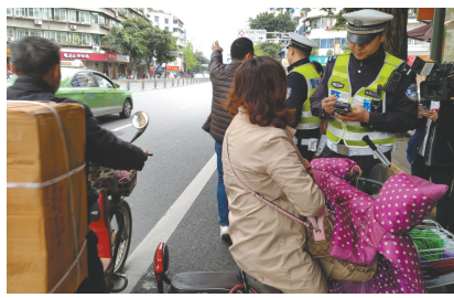
电动车横穿马路被罚。