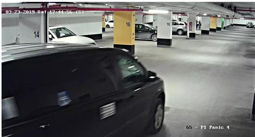
案发时的监控视频显示陆姓留学生被嫌疑人绑上车。